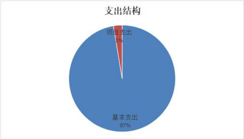
图 2. 支出预算图

上缴上级支出 0 万元，占 0 %； 对附属单位补助支出 0 万元，占 0 %。