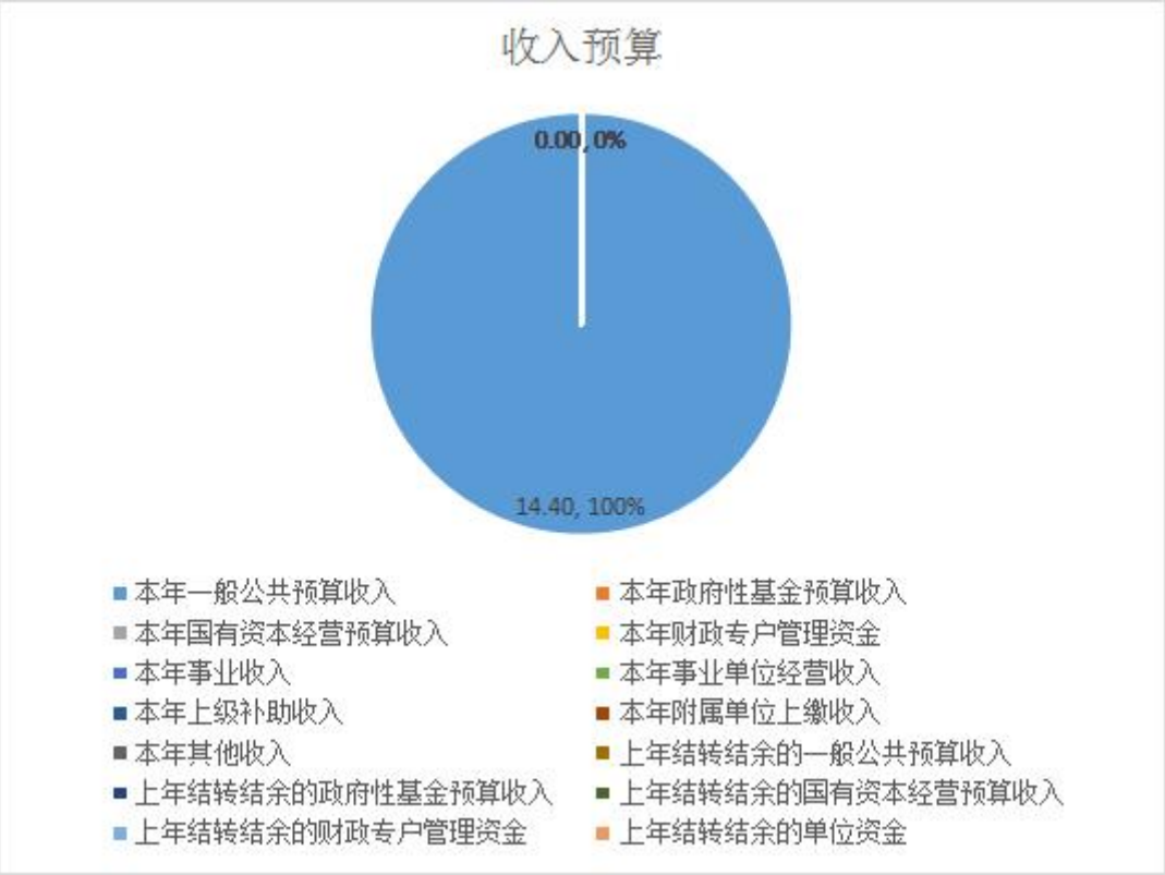
图 1. 收入预算图

上年结转结余的政府性基金预算收入 0 万元，占 0%； 上年结转结余的国有资本经营预算收入 0 万元，占 0%； 上年结转结余的财政专户管理资金 0 万元，占 0%； 上年结转结余的单位资金 0 万元，占 0%；